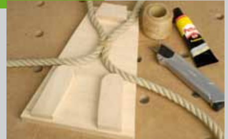
Bild. Nachdem der Leim getrocknet ist, werden alle Leimreste entfernt und mögliche raue Stellen nachgeschliffen. Die Oberflächenversiegelung muss in diesem Fall für die Verwendung bei Kinderspielzeug geeignet sein.